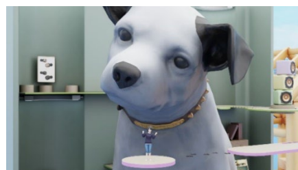
&lt;フотスポットからの撮影イメージ&gt;

「REV WORLDS」内の仮想新宿にて、アルタビジョン前から目印となる足跡に沿って歩いていくと、ビルの高さほどにそびえ立つビッグスケールのニッパーが出迎えます。パーク内に設置されたスロープを登ったり、空間上の台に飛び移ったりして「ニッパー」の顔まで登ると、フотスポットで写真撮影することができます。