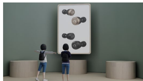
<Victor ブランド製品紹介コーナーイメージ>

Victor ブランドの最新製品を紹介するコーナーを用意し、製品の詳細を確認いただけます。また、公式オンラインストア「JVCKENWOOD STORE」へもリンクし、気に入った製品を購入することもできます。