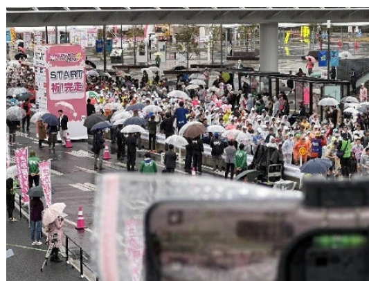
<「さが桜マラソン 2024」での「yourLIVE」配信向け撮影場面>