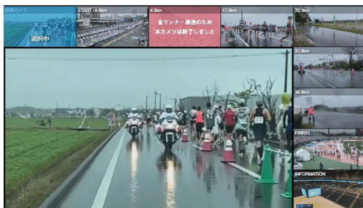
<「さが桜マラソン 2024」での「yourLIVE」配信画面>

今回は、スマートフォンで撮影したライブ映像をLTE、5Gサービス(一般回線)を使い、「yourLIVE」サーバへ伝送することで、撮影場所への配線などの作業なしで、配信可能としました。