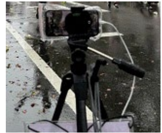
<配信向け撮影用スマートフォン（雨天対策を行い使用）>

株式会社ドコモビジネスソリューションズ九州支社 佐賀支店の協力により、撮影カメラとしてスマートフォン 8 台が貸与され、映像送信にはLTE、5Gサービス（一般回線）を使用。撮影場所への配線などの作業なしで、配信可能としました。