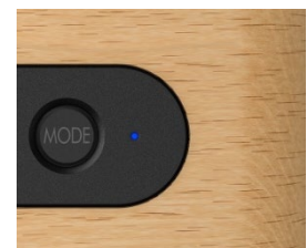
<ステレオ再生時 L 側 LED 点灯イメージ>

両モデルとも拡張機能として、ステレオペアリング機能に対応し、同一機種を 1 台増設することにより、セパレートコンポのような広がりのあるステレオ再生が楽しめます。同機能は、天面のモード専用ボタンで簡単に ON/OFF が可能です。なお、同機能使用時は L(左側：青)と R(右側：赤)で異なる色の LED が点灯するため、ひと目で分かります。