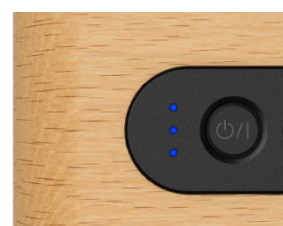
<電池残量表示イメージ（満充電時）>