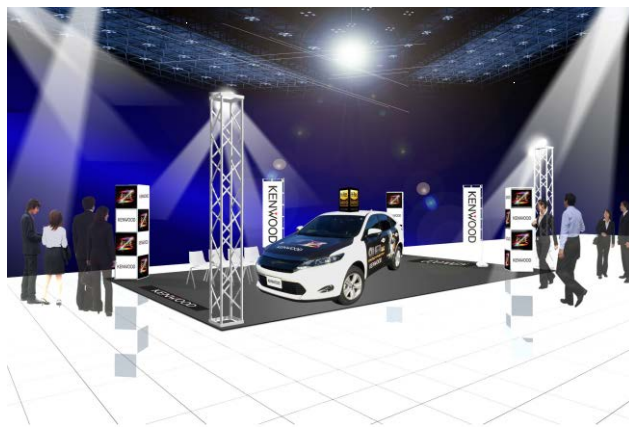
<JVCケンウッドブース（展示イメージ）>