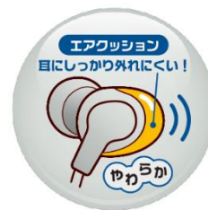
<“エアクッション”イメージ>

柔らかなシリコンボディに空気（エア）を閉じ込めた、“エアクッション”を採用。ソフトな装着感ながら、耳から外れにくいボディ形状により安定したフィット感を実現し、快適にワイヤレスリスニングが楽しめます。