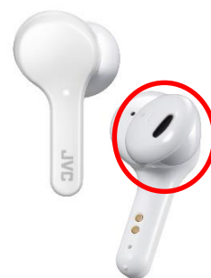
<新形状のハウジング>

充電ケースは持ちやすい小型の形状で、本体とケースにマグネットが付いており落下防止に役立ちます。