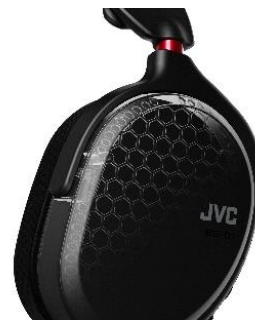
<ハニカムリブのイメージ>