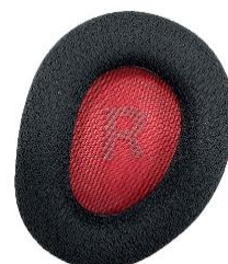
<スポーツメッシュイヤーパード>

肌触りが良く、蒸れにくい素材を使ったスポーツメッシュイヤーパードを採用。長時間使用時にも気になる蒸れを軽減し、ドライで快適な装着感を維持します。また柔らかく厚みのあるクッションを採用しているため、安定感があり長時間装着しても快適です。