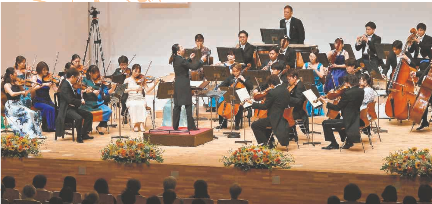
大成功に終わった2025年の「青い海と森の音楽祭」