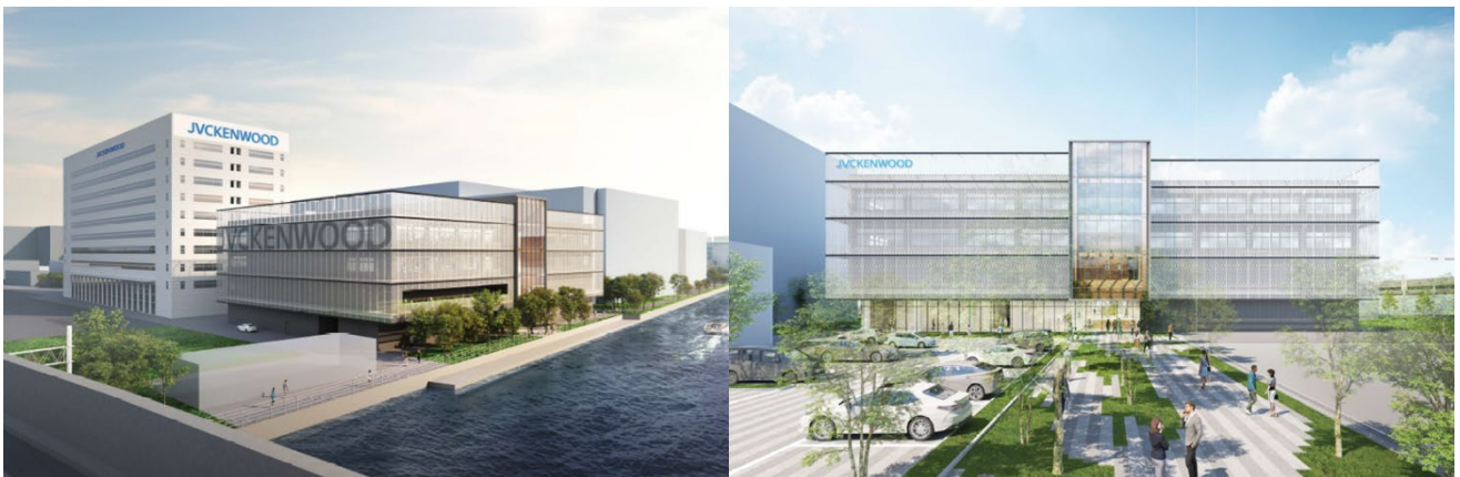
<「Value Creation Square（仮称）」（横浜本社地区）完成予想図（2024年夏完成予定）>

このような中長期的な企業価値向上に向けた取り組みの一環として、このたび価値創造の拠点「Value Creation Square（仮称）」を創設します。これまで分野別・拠点別だった技術部門と本社コーポレート部門および「未来創造研究所」との連携強化により、グローバルなメガトレンドに対応した技術開発を強化。また、ハイブリッドワークを実現するオフィス環境の整備により、さらなる働き方改革を推進し、新たな価値創造を実現していきます。