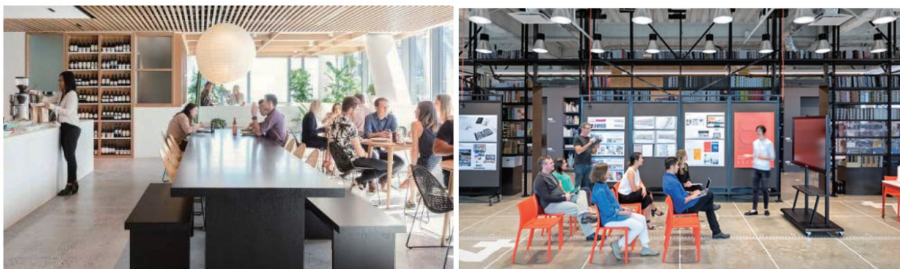
<オフィスイメージ>