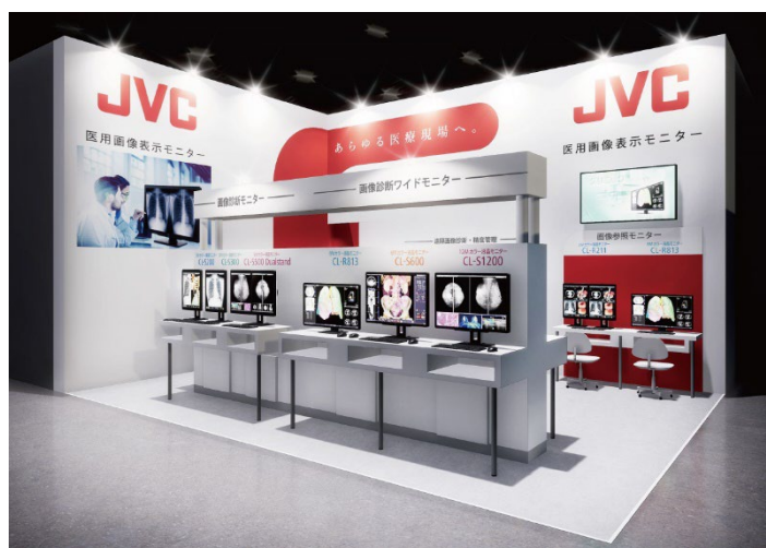
<当社ブースイメージ>

本ブースでは、USB Type-C（DisplayPort Alternate Mode）に対応した、21.3型300万画素カラー液晶モニター“i3シリーズ”「CL-S301」の参考出品をはじめ、大画面モデルや標準モデルなど、医用画像表示モニターのフルラインアップを展示。今後の普及が想定される遠隔・在宅読影やAI時代に対応するソリューションを実演・提案します。