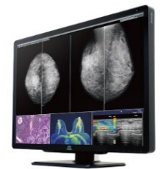
< 「CL-S1200」 >

業界最高水準※の1200万画素のワイド大画面を実現したマンモグラフィ向け医用画像表示モニターの「CL-S1200」を展示します。マンモグラフィ画像の二画面表示をはじめ、CT・MRI・超音波・病理などの画像の同時表示に対応。自由なウィンドウレイアウトが可能のため、さまざまな医用画像やAI解析結果などを1台で効率よく表示でき、読影作業の効率化や負担軽減、スペースの有効活用に貢献します。また、AIの学習のために大量の教師データの作成が必要な医用画像AIソフトウェアの開発においても、大画面・高画質表示により、長時間かつ集中力を要する医師の作業をサポートします。