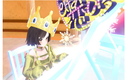
＜広瀬香美さんの3Dアバター＞

昨年「バーチャルマーケット 2022 Summer」出展時にも SNS など話題となった、広瀬香美さんの3Dアバターが今年も登場します。今年は大ヒット曲「ゲレンデがとけるほど恋したい」のダンスコンテンツを企画。昨年、「ロマンスの神様」に振り付けをして SNS で大ヒットしたダンサーのタイガさんのオリジナルモーションを使用し、誰でも簡単に自分のアバターでタイガさんの振り付けを踊れます。また、ダンスコンテンツのイベントとして、ギネス世界記録™にも挑戦します（詳細は後述）。