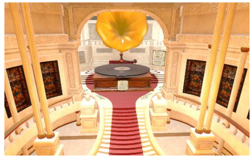
＜コンサートホールの内観イメージ＞

“音楽の殿堂”をイメージし、蓄音器をモチーフにしたオリジナルの巨大なコンサートホールのブース内で、さまざまな体験を提供します。VR機器やゲーミングPCから参加する「VRChat」と、スマートフォン、PCからWebブラウザで参加する「Vket Cloud」の2つのプラットフォームから参加が可能です。