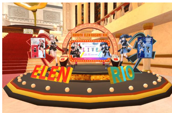
＜「黒杜えれん」、「波澄りお」のコーナー＞