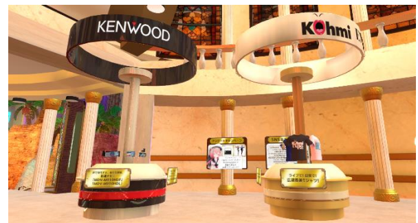
＜左が「Victor」、「JVC」、右が「KENWOOD」、広瀬香美さんのオススメ商品の購入コーナー＞