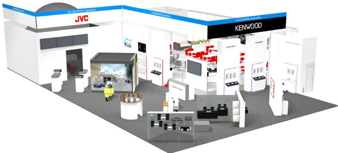
<当社ブース（イメージ）>

今回当社ブースでは、欧州市場で高いシェアを維持するカーエレクトロニクス商品の多彩なラインアップをはじめ、さまざまなシーンで音楽を楽しむホームオーディオやポータブルオーディオ、ワイヤレスヘッドホンの新商品を展示。また、ホームシアター用プロジェクターのシアタールームを設置し、8K 高精細映像やドームスクリーンを使用した臨場感ある映像を体感いただけます。