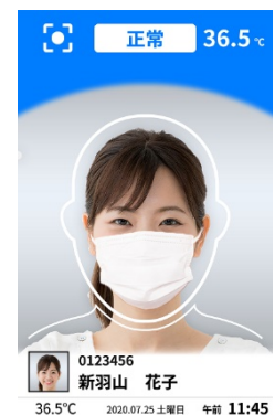
<顔認証機能 画面イメージ>