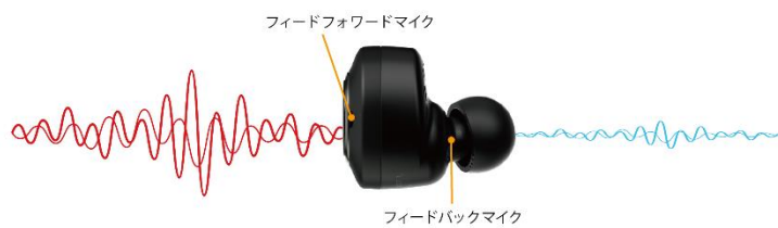
<ハイブリッドアクティブノイズキャンセリング機能>

本機は、二つのマイクを採用したハイブリッドアクティブノイズキャンセリング機能に加えて、高いノイズキャンセリング効果を得られる最新ノイズキャンセリング技術Qualcomm ® アダプティブノイズキャンセルを採用。耳への装着状態を常にモニタリングすることで、装着がずれても自動でノイズキャンセリングレベルを補正し、いつでも安定して高いノイズキャンセリング効果を得られます。さらに、新イヤピース（後述）により、パッシブのノイズキャンセリング効果も高めました。通話時にもノイズキャンセリング機能をオンにできるため、外出時などの騒がしい環境下でも快適に会話できます。