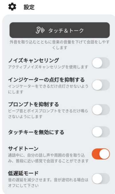
<サイドトーン機能使用時 (イメージ) >