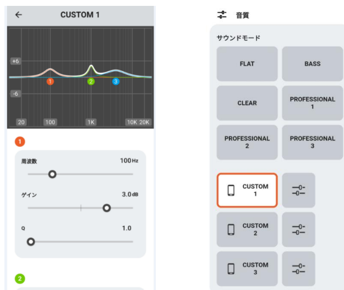
<カスタムイコライザー機能（イメージ）>

本アプリを使用することで好みの音質に調整が可能なカスタムイコライザー機能を追加。パラメトリックタイプのイコライザーを採用し、周波数とゲイン、Qの値をそれぞれ細かく、自由に調整することができます。なお、調整した音質設定は、3つまで保存が可能です。