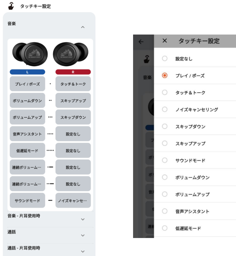
<タッチキー設定 (イメージ) >

本アプリを使って、イヤホン本体のタッチキー操作にほぼ全ての機能を自由に割り当てでき、自分好みにカスタマイズすることが可能なキーアサイン設定機能を追加。タッチキーの左右8パターンの操作それぞれに、プレイ/ポーズやボリュームのアップ/ダウンなどの基本操作から、ノイズキャンセリングやサウンドモードの切り替えまで、ほぼ全ての機能を自由に割り当てることを可能にしました。さらに、機能の割り当ては、音楽リスニング（両耳/片耳）および通話時（両耳/片耳）という4つの利用シーンごとに設定できます。よく使う機能を簡単なタッチ操作に割り当てるなど、ユーザーの使い勝手に応じたカスタマイズを可能にします。