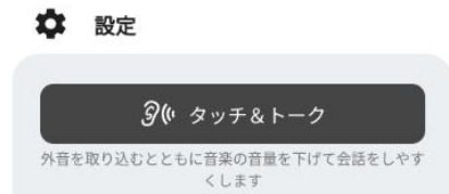
<外音取り込み時再生音量設定 (イメージ) >