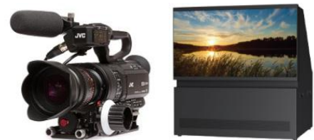
「 GY-LS300 」 「 LY-HDR36G-2/-4 」

バージョンアップにより機能を追加した、「GY-LS300CHU」の JVC Log 記録による HDR(ハイダイナミックレンジ)のデモンストレーションを行います。「J-Log1」という当社独自のガンマカーブ特性で収録することで、記録が可能な明るさのレンジを拡大しながら、階調豊かでフィルムライクな映像表現が可能となり、これまでにない映像表現が可能となります。デモンストレーションには、当社 HDR リアプロジェクションシステム「LY-HDR36G-2/-4」を使い、この拡張されたダイナミックレンジの効果を体感いただけます。