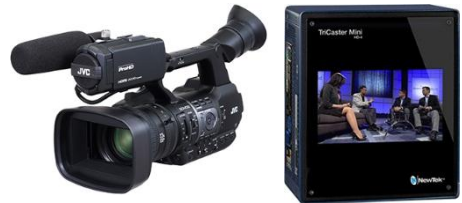
「NewTek 社との無線ライブ映像制作システム」

NewTek 社製のライブ映像制作用ターンキースタジオスイッチャー「TriCaster™」シリーズを使った無線ネットワークによるライブ映像の制作システムを展示します。当社の IP ストリーミングカメラと NewTek 社のターンキーライブスイッチャーによる無線ネットワーク上に構成できる安価で設置自由度の高いシステムです。