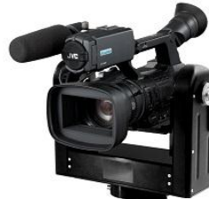
「HD 制作用リモートカメラシステム」