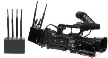
「 JVC プライベート MESH ビデオネットワーク 」

Silvus 社が開発した無線プライベートネットワーク伝送システムと当社の IP ストリーミングカメラにより、通信品質の高い、高画質な HD 映像の配信を安価に構築できるシステムです。