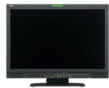
「 DT-V24G2 」

放送局向けモニターとして好評を得てきた「DT-V シリーズ」の新品を参考出品します。新たに高画質エンジンを採用し、10bit の広色域に対応した 24 型モニター。編集や映像確認など高い映像再現性が要求される用途向けとして提案します。