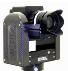
「4K 対応リモートカメラシステムシステム」

英国Bradley社 (BR Remote Ltd.) との協業により共同開発した4K対応リモートカメラシステムを展示します。当社のグループ会社である、AltaSens社の4K/60p対応 Super35mmイメージセンサーを搭載したカメラモジュール「AL-CM460」と、Bradley社のリモートヘッドの組み合わせにより、遠隔地からのパン・チルト・ズーム動作と4K/60pの映像信号をファイバーケーブル1本で伝送できるリモートカメラシステムです。次世代の4K映像制作に向けて、スタジオ収録やスポーツイベント撮影などのさまざまな制作分野に対応します。また、当社ProHDカメラレコーダー「GY-HM660U」とBradley社のリモートヘッドとの組み合わせによるHD制作用リモートカメラシステムも合わせて展示します。