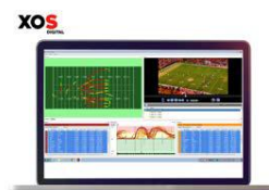
スポーツコーチングイメージ