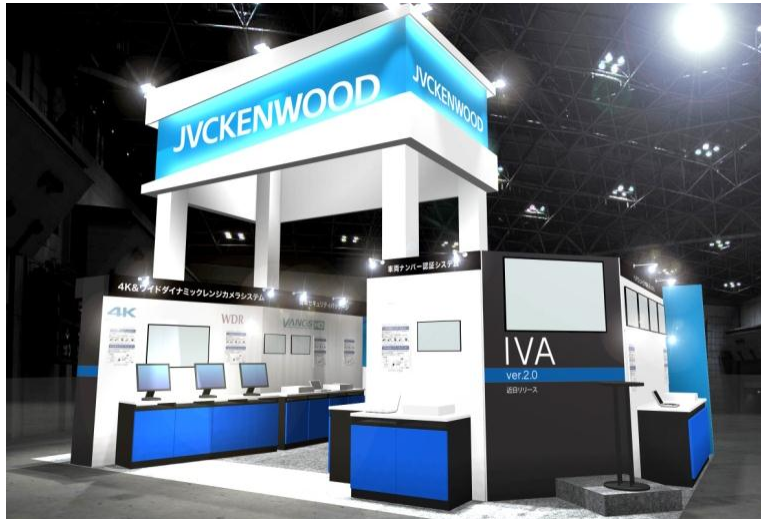
< JVCケンウッド・公共産業システムブース(イメージ) >

顔検索機能やウェアラブルカメラ対応で検索対象が広がり、さらに進化した「インテリジェント・ビデオ解析システム」をメインに、同軸 HD カメラシステムや高画質 4K 監視ソリューションなどを展示します。