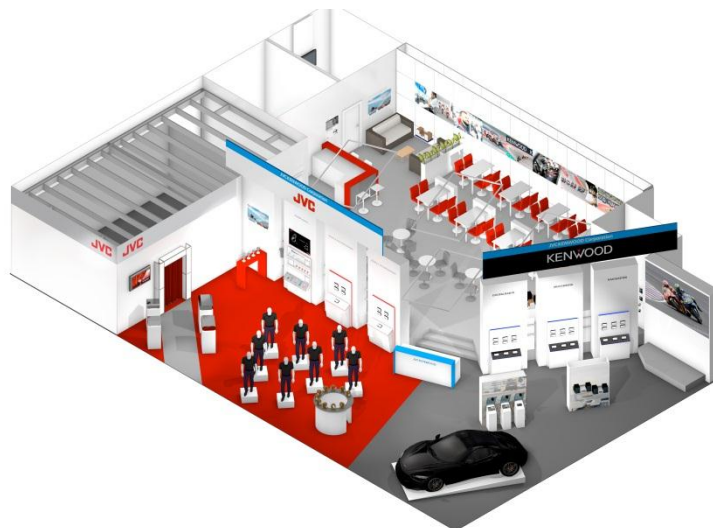
<当社ブース（イメージ）>

今回の当社ブースでは、欧州市場で高いシェアを維持するカーエレクトロニクス商品の多彩なラインアップをはじめ、スポーツ向けなどさまざまなシーンに対応するワイヤレスヘッドホン商品群や、アウトドアなどのタフなシーンでの撮影に対応する民生用 4K ビデオカメラ等を展示。また、ホームシアター用プロジェクターの新商品を初公開し、高精細な映像デモンストレーションをいち早く体験いただけます。さらに、当社がデジタルコックピットを共同開発したマクラーレン・オートモーティブ社の「McLaren 720S」も参考展示します。