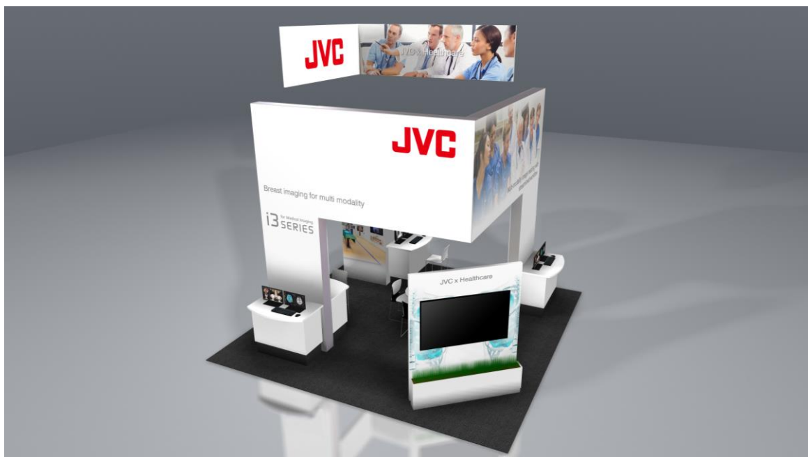
<当社ブースイメージ>

今回の当社ブースでは、読影作業効率の向上とモダリティ機器との調和をコンセプトとした PACS 向け医用画像表示モニター“i3 シリーズ”に加え、医用画像表示モニターのスタンダードモデルの新商品や、使いやすさで好評を得ている医用モニター精度管理ソフトウェアなどを展示。当社独自の画像／映像処理技術を生かした医用画像モニターを核とする医療向けソリューションを提案します。